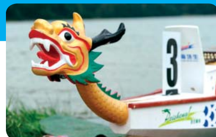
Závody dračích lodí v posledních letech nabírají na popularitě

Hned tři závody Dračích lodí se letos konají na jihočeské části řeky Vltavy. Nejprve se ve dnech 21. a 22. května koná Lipno Dragon Boat Race – 9. dračí mistrovství Lipenské přehrady, posléze 18. června akce nazvaná Dračí loď České Budějovice 2016 na soutoku Vltavy a Malše a 2. července bude další závod hostit Purkarec na Hněvkovické přehradě. ( www.dragonboat.cz )