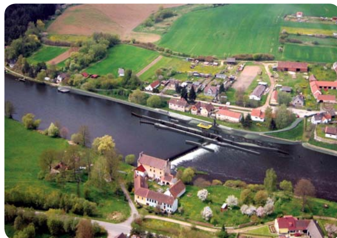
Vizualizace plavební komory na hněvkovickém jezu