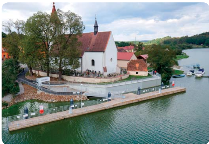
Nové přístaviště v Purkarcí

Zbývá dokončit poslední úpravy – jez a plavební komoru v Hněvkovicích nad Vltavou – a horní Vltava bude kompletně splavná. Celých 100 kilometrů z Českých Budějovic až ke hrázi od Orlické přehrady bez přerušení. Stavební práce budou hotové už letos na podzim a příští plavební sezona tak bude již zcela plnohodnotná.